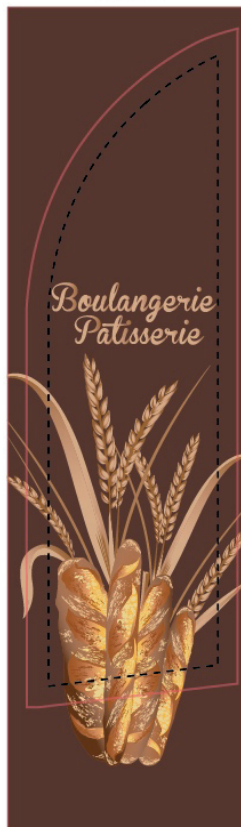
Gabarit + Maquette client