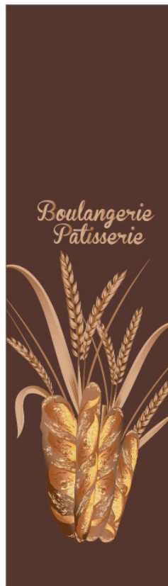
Maquette « nettoyée ».